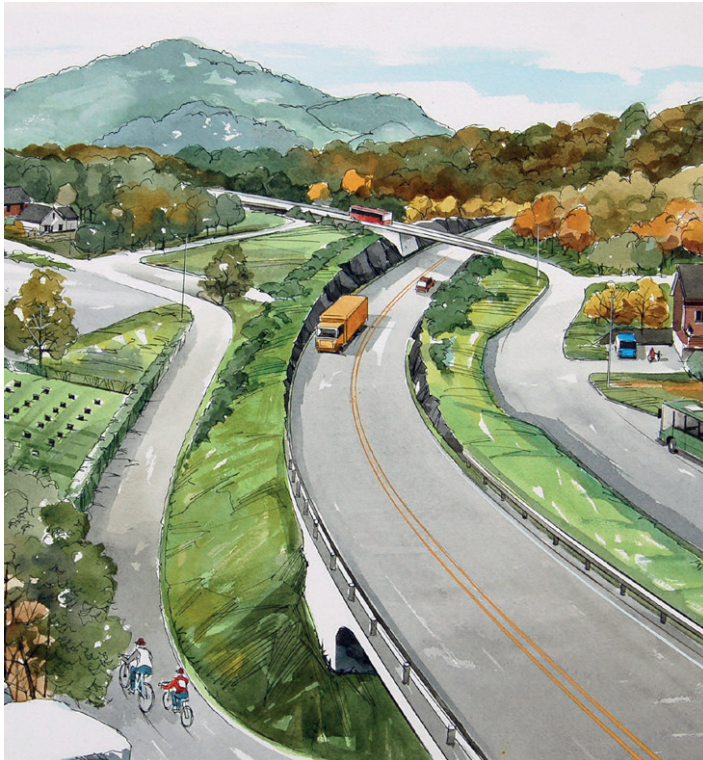
Dagens E134 går over i ny trasé ved Skjold kyrkje