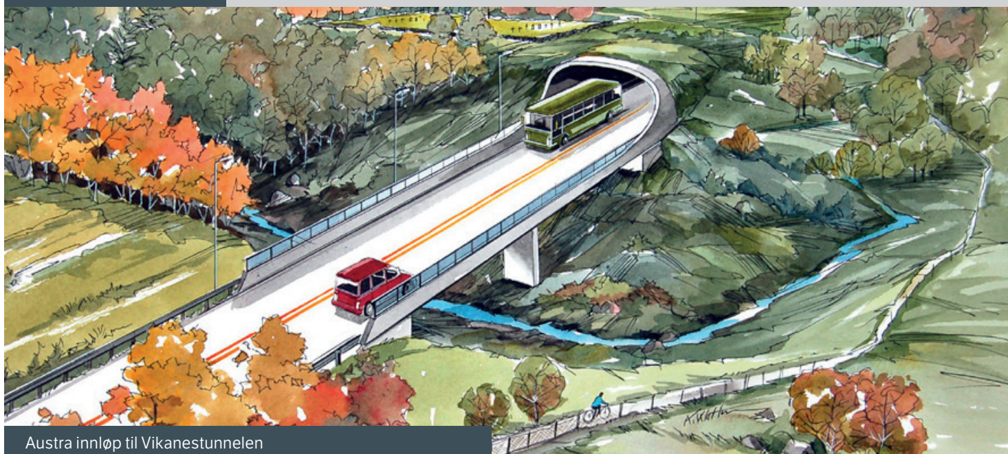
Austra innløp til Vikanestunnelen

Målet med prosjektet er å legge gjennomgangstrafikken på E134 utanom busetninga i Skjold. På det viset blir strekninga meir effektiv for dei som reiser gjennom, og tryggare for dei fastbuande i Skjold.